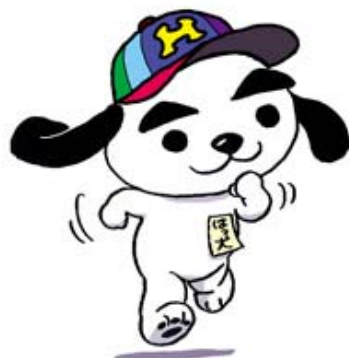
イメージマスコット「はっ犬くん」

NPO 法人「生活の発見会」は、 森田理論の集団学習を目的として 1970 年に創立。 年間登録会員数 2,500 名以上、 毎月全国 120 ヶ所以上の集会（集談会）で 会員同士による相互学習を行っています。 1998 年にはその活動が評価され、 「保健文化賞」を受賞しました。